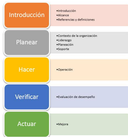
Figura sustraída del Ciclo de mejora continua norma ISO/IEC 27001:2013

Dado lo anterior el modelo se va a basar en el ciclo PHVA, el cual es recomendado por la norma NTC-ISO/IEC 27001:2013 Centrándose en los requisitos cubiertos en los capítulos 4 a 10, y si bien ISO-27002 deja de ser una referencia normativa aún es necesaria para implementar este estándar.