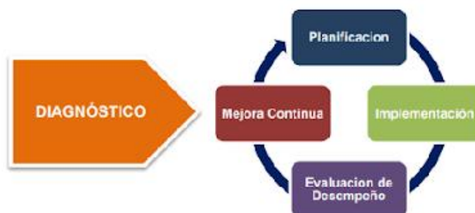
Figura 1 – Ciclo de operación del Modelo de Seguridad y Privacidad de la Información

De acuerdo con la expedición del Decreto 2573 de 2014 contenida en el Decreto Único Reglamentario 1078 de 2015 , comprende cuatro grandes propósitos: lograr que los ciudadanos cuenten con servicios en línea de muy alta calidad, impulsar el empoderamiento y la colaboración de los ciudadanos con el Gobierno, encontrar diferentes formas para que la gestión en las entidades públicas sea óptima gracias al uso estratégico de la tecnología y garantizar la seguridad y la privacidad de la información, por lo cual el modelo de seguridad y privacidad de la información contempla un ciclo de operación que contempla cinco (5) fases que a su vez el modelo puede operar en el ciclo PHVA basado en la ISO 27001, las cuales permiten que las entidades puedan gestionar adecuadamente la seguridad y privacidad de sus activos de información.